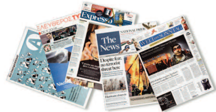
Die aktuellen „World's Best Designed Newspapers“.