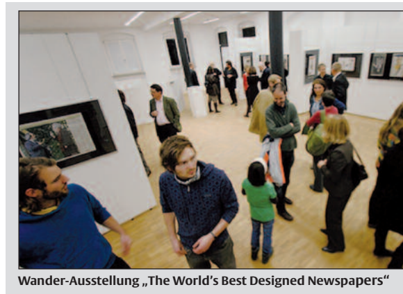
Wander-Ausstellung „The World's Best Designed Newspapers“

Anschliessend Mittagsbüffet, gesponsert vom Land Oberösterreich.