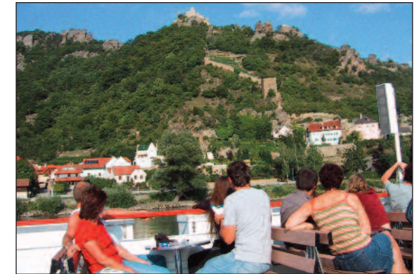
Ausflugsschiff durch die Wachau

Exkursion in die Wachau (bei genügend Interessenten): Für diejenigen, die sich etwas mehr Zeit genommen haben für Ihre Reise nach Österreich, bietet sich ein Ausflug in die nahe gelegene Wachau an (Entfernung mit dem Auto ca. eine Stunde, mit dem Zug eineinhalb Stunden bis Melk). Empfehlenswert ist dort eine Besichtigung des Stifts Melk, das über Jahrhunderte Europas Geistes- und Kulturgeschichte mitbestimmte. Täglich zweimal fährt ein Donauausflugsschiff von Melk nach Krems durch eine der schönsten Flusslandschaften Europas.